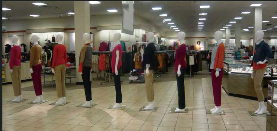
通路に整列！最後の一人は決めポーズ