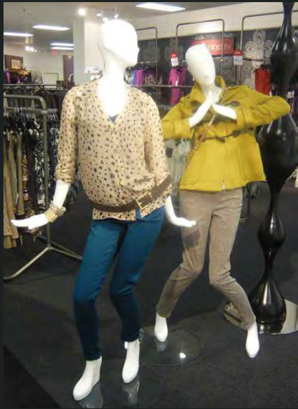
少し変わったポーズのマネキン